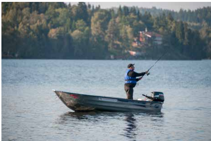
Ullinge Wårdshus är ett landsbygdshotell som ligger inbäddat i skogen vid stranden av Södra Wixen.

De senaste åren har kortförsäljningen omsatt mellan 35 000 och 45 000 kronor och utgör största delen av föreningens sammanlagda inkomster.