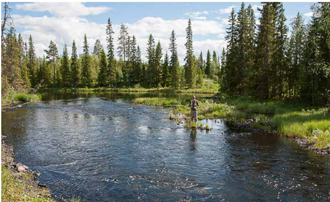
Att ransonera fisketrycket kan vara en viktig fiskevårdsåtgärd.

saknar fiskerätt. Samägda fastigheter eller dödsbon har endast ett medlemskap. Ägare till flera fastigheter har endast ett medlemskap. Arrendator eller servitutshavare kan ersätta ägare som medlem i föreningen.