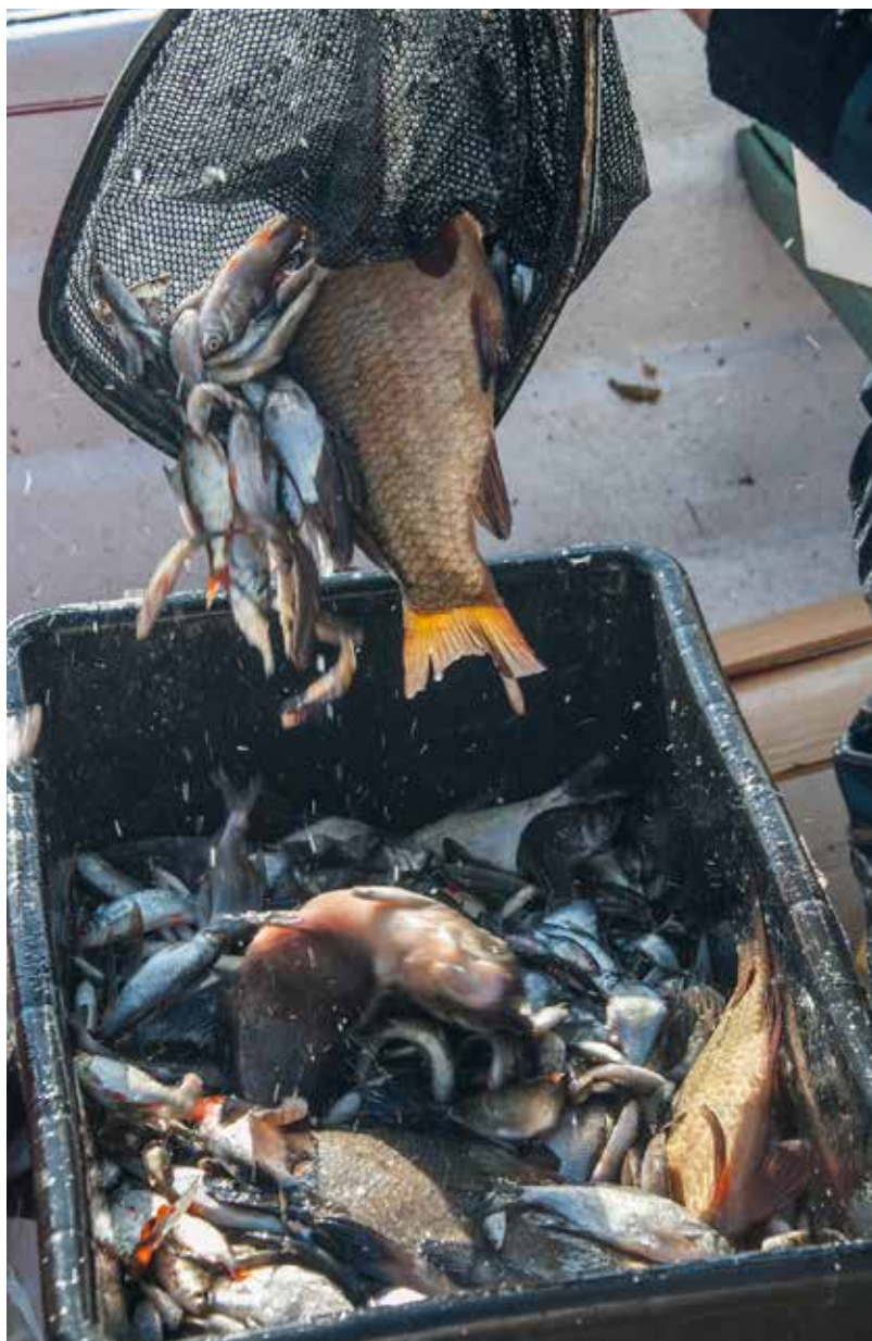
Decimeringsfiske är en fiskevårdsåtgärd som minskar övergödningen och gynnar rovfiskarna.

Den som saknar fiskekort eller annat tillstånd gör sig skyldig till olovligt fiske enligt fiskelagen. Olovligt fiske ska polisanmälas om det inte är uppenbart att det beror på missförstånd eller liknande omständigheter.