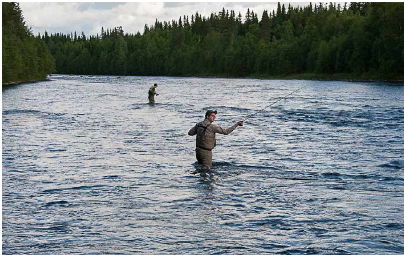
I de flesta sjöar och vattendrag med attraktivt fiske måste fiskevattenägarna samverka för att kunna upplåta fisket.

Fisketurism och annan fiskeanknuten näringsverksamhet gynnas av att det finns ett fiskevårdsområde. Samverkansavtal mellan turistentreprenörer och fiskevårdsområdet ger tydliga och långsiktiga spelregler, oavsett om entreprenörerna är fiskerättsägare eller externa aktörer.