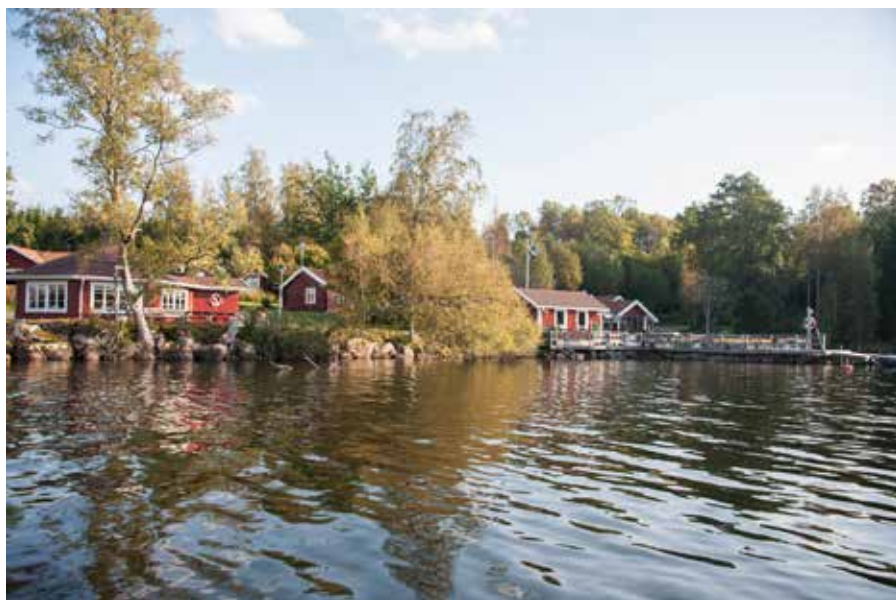
Paradis fiskecamp är ett av de företag som bedriver näringsverksamhet med Södra Wixens kräftor och fisk som viktigaste råvara.

Södra Wixen är 510 hektar stor och har cirka 25 fiskerättsägare. Fiskevårdsområdet består av både samfälligheter och fastigheter med eget skiftat fiskevatten. Största enskilda fastigheten äger drygt 20 procent av sjöns fiskerätt medan de