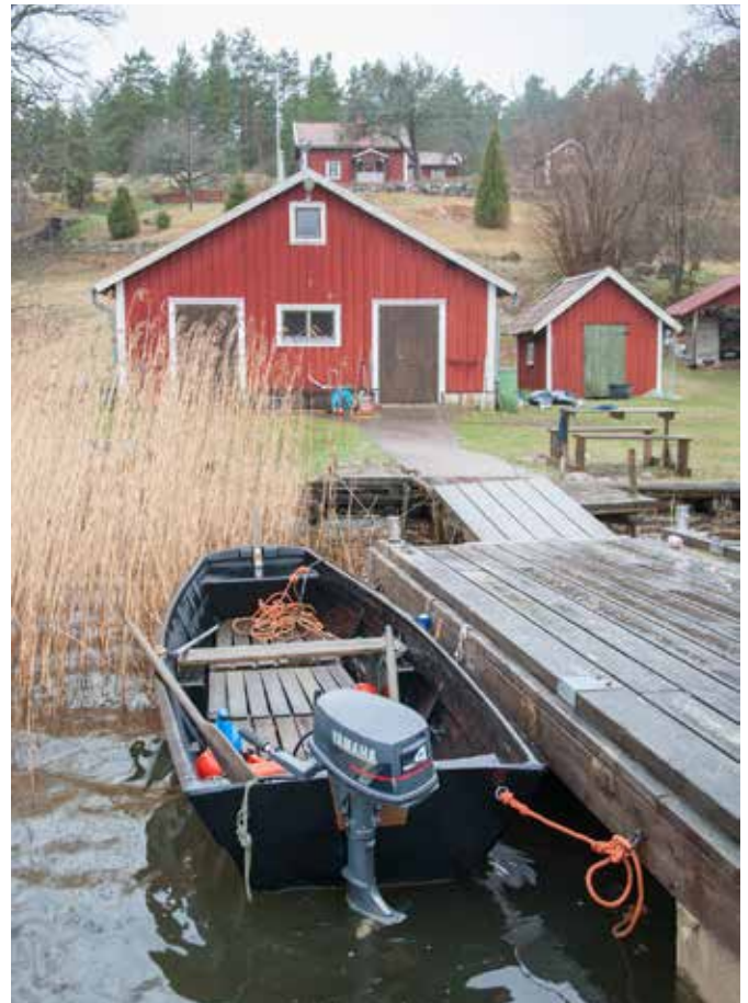
Det är inte möjligt att bilda fiskevårdsområde för fiske som är fritt för allmänheten.

I bondesamhället användes skördar och fångster i huvudsak för självhushåll. Ända fram till mitten av 1900-talet bedrevs fisket mestadels för husbehov och fiskevattnens viktigaste uppgift var att bidra till livsmedelsförsörjningen. Urbaniseringen medförde att husbehovsfisket upphörde i många sjöar. Fiskerättens värde och betydelse minskade. Under senare delen av 1900-talet ökade intresset för fiskevattnen igen, men nu som källa till rekreation. Sportfiske och fisketurism skapade ny efterfrågan på produktiva fiskevattnen. Det var också en av orsakerna till att en ny och förenklad Lag om fiskevårdsområden stiftades 1981.