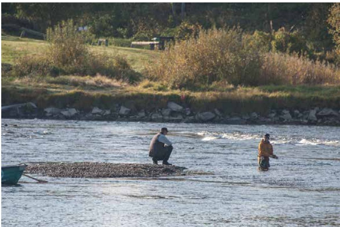
Fisket är bäst vid Forshagaforsen, men om Klarälvens fiskeråd lyckas med sitt arbete så kommer lax och öring att kunna vandra av egen kraft ända upp till norska gränsen.

oss vore det fantastiskt att kunna öppna älven och få uppvandrande lax.