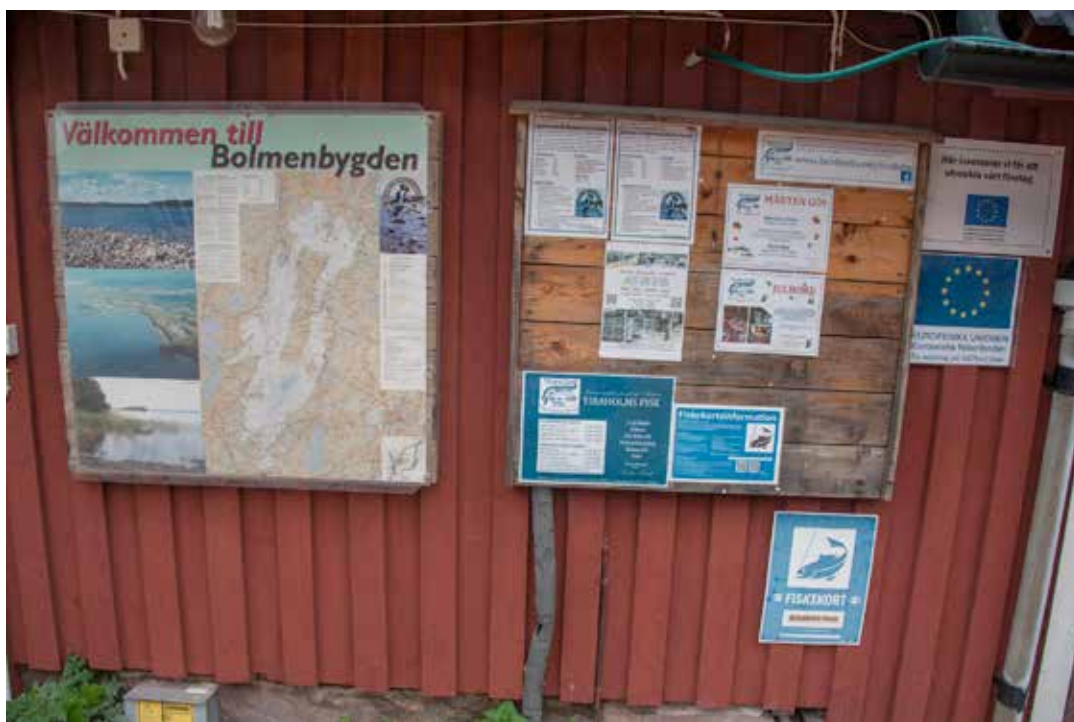
Försäljning av fiskekort och information om fisket finns på många platser runt Bolmen.

– Gösbeståndet är så starkt att trycket på små abborrar och på sik-