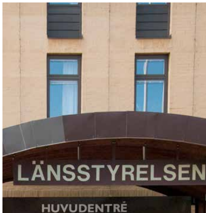
Länsstyrelsen beslutar om bildande och fastställer de första tio paragraferna i fiskevårdsområdesföreningens stadgar.

Första fiskestämman ska välja ordinarie styrelse och besluta om stadgarnas paragraf elva och framåt. Liksom vid kommande ordinarie fiskestämmor är första