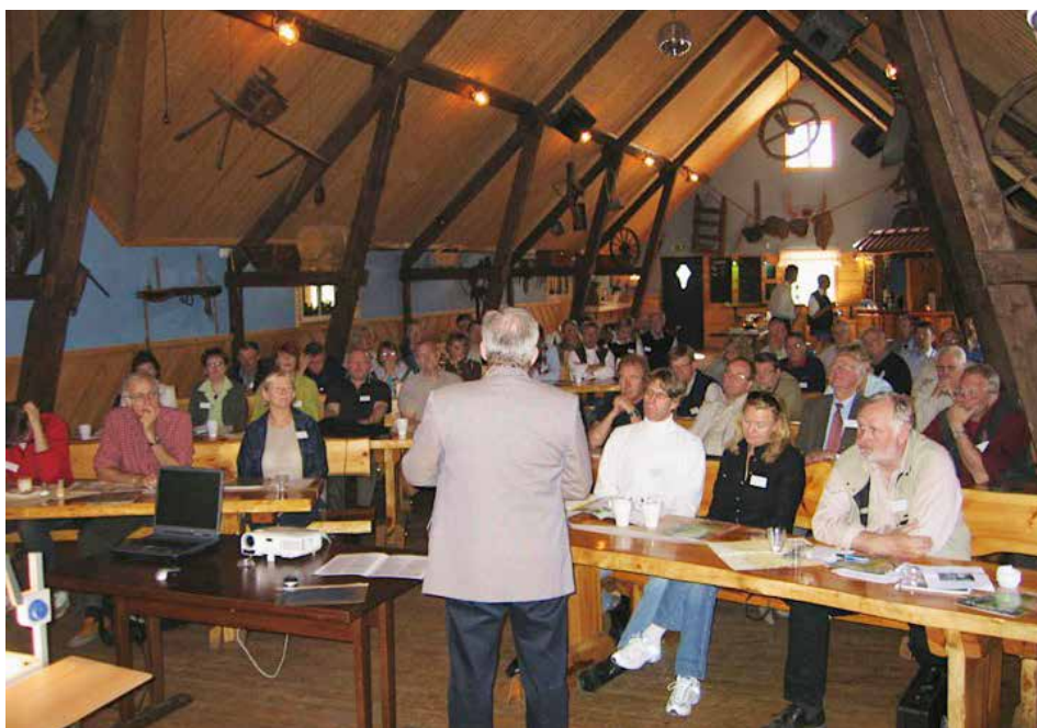
Under processen med att bilda fiskevårdsområde bör så många fiskerättsägare som möjligt vara delaktiga i processen.

Är alla överens från början eller krävs förrättning?