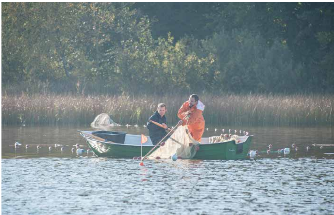
Av stadgarna ska det framgå vilket fiske som omfattas av fiskevårdsområdets verksamhet.

Ansökan om uteslutning av fiske kan göras av fiskevårdsområdesförening eller av den enskilde fiskerättsägaren. Uteslutning kan ske på samma grunder som uppdelning av ett fiskevårdsområde. Vid sådana förändringar prövas bland annat om fisket, eller fiskena, kan utgöra en egen enhet för fiskevård och om kvarvarande fisken även i fortsättningen kan utgöra ett lämpligt område.