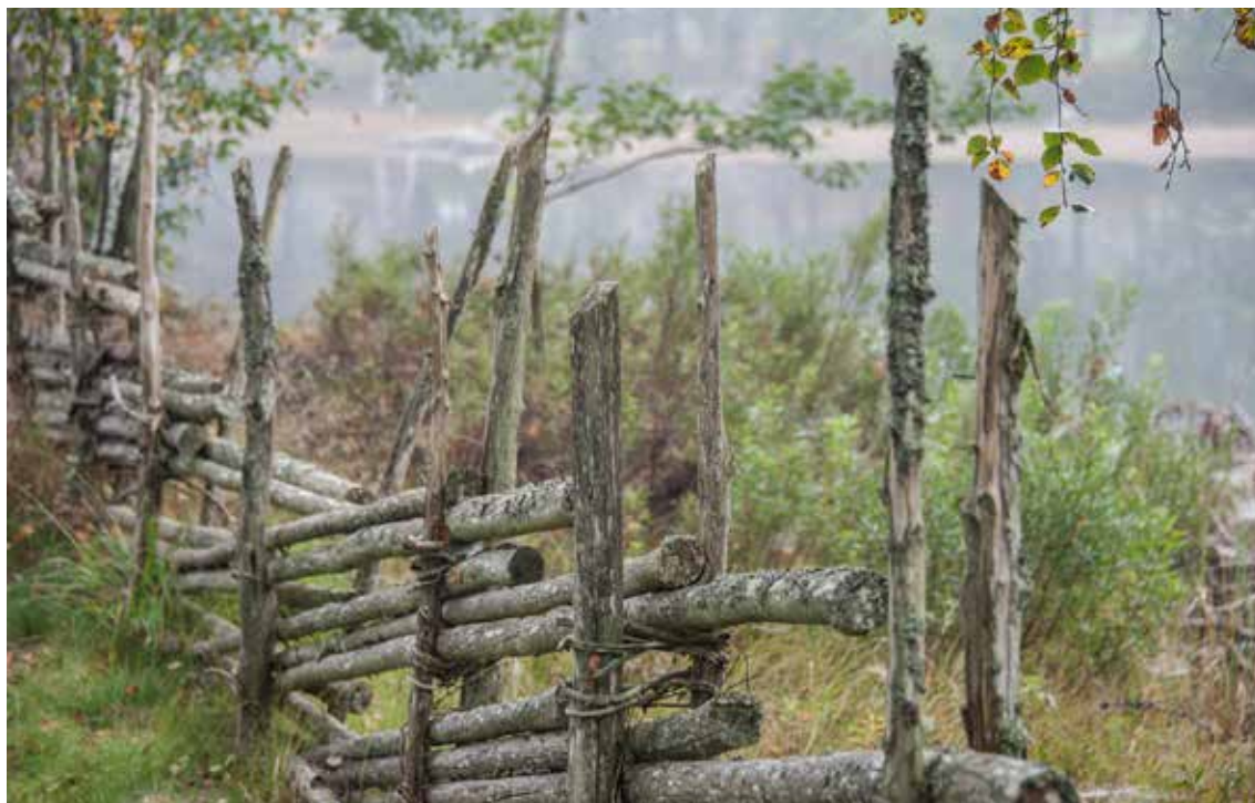
Fiskerätten tillhör fastigheterna.

Äganderätten viktig del av samhällsbygget