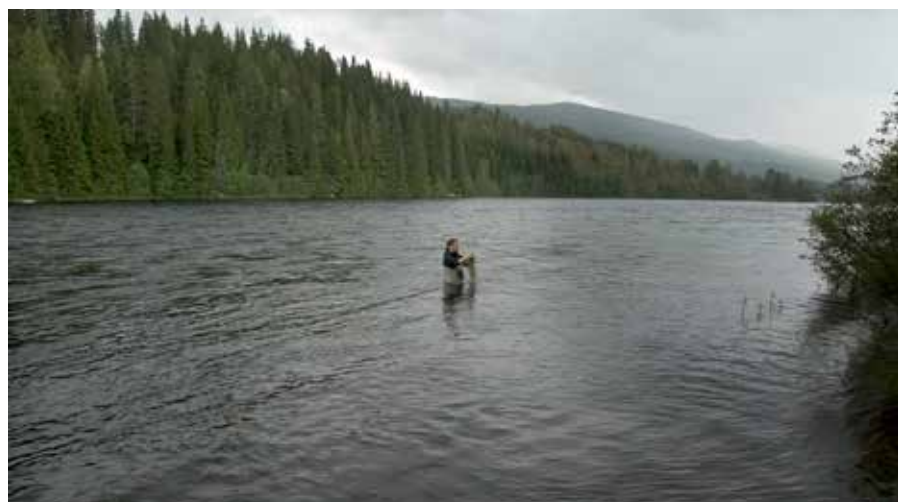
Forskningsprojektet ”Vänerlaxens fria gång” byggde upp kunskaperna för att öppna vandringsvägar förbi kraftverken. Fiskevårdsområdenas stöd var en förutsättning för projektet.

2014 bildades Klarälvens fiskeråd, ett samverkansorgan med det uttalade långsiktiga övergripande målet att öppna för vänerlaxens