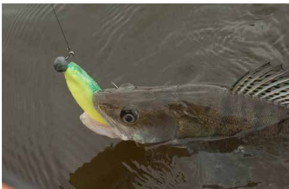
Nya fiskevårdsområden har ökat utbudet av sportfiske i Sverige.

Fiskestämman bör ge utrymme för diskussioner om fiskeförvaltningens inriktning under det kommande året och på lång sikt, och riktlinjer för styrelsens arbete. Styrelsen genomför stämmans beslut.