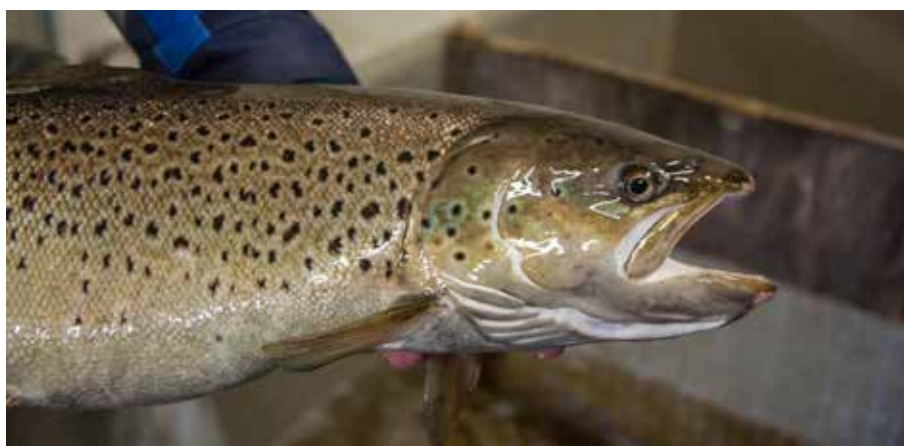
Även öringen skulle gynnas av fria vandringsvägar.