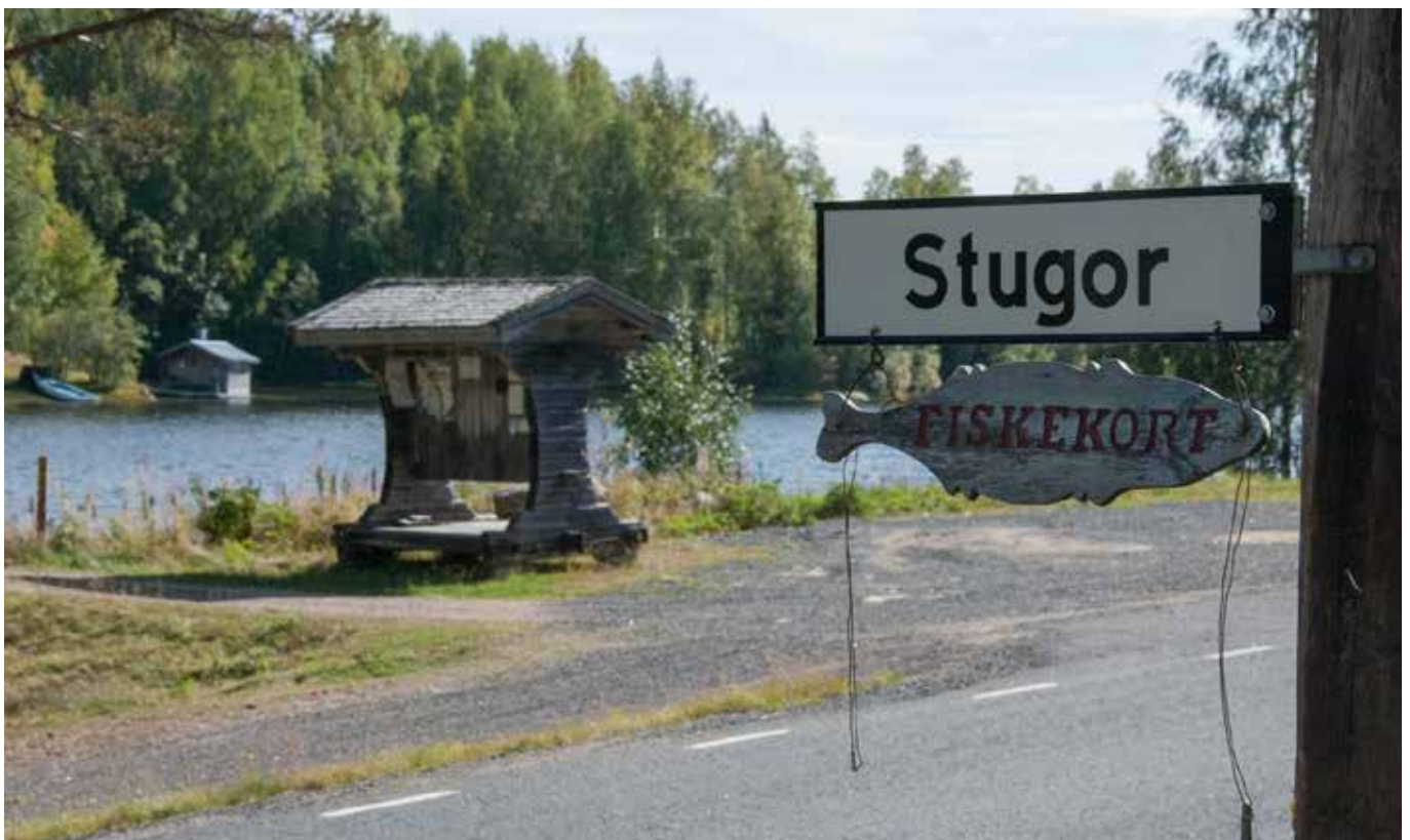
Samarbete i ett fiskevårdsområde underlättar utvecklingen av fisketurism. Det blir enklare för entreprenörer och fiskerättsägare att träffa avtal.

Trots att bildandet av fiskevårdsområden varit framgångsrikt finns fortfarande många fiskevatten som saknar ändamålsenlig fiskeförvaltning. Fler fiskevårdsområden skulle kunna bildas. Det finns många goda skäl till att samverka om fiskeförvaltningen.