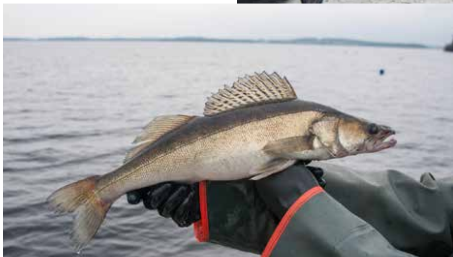
Gösen är Bolmens karaktärsfisk men älfisket har genom tiderna också varit mycket viktigt i Bolmen.