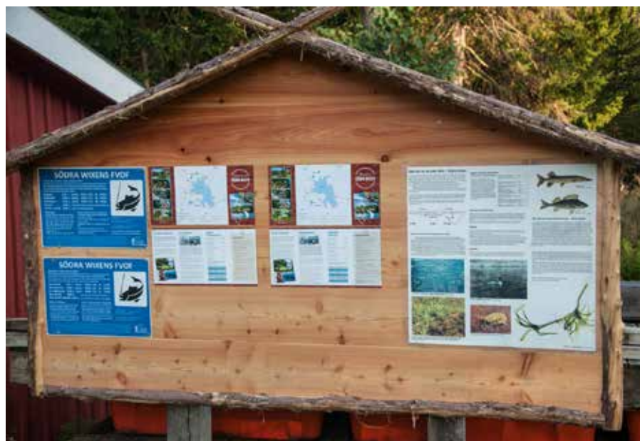
Södra Wixens fiskevårdsområdesförening har nyligen gjort en satsning på information för att underlätta för gäster och fiskekortsköpare.

– Vårt övergripande mål är att kunna lämna över en sjö och en bygd till våra efterlevande där det finns en ren miljö men där man inte tagit bort möjligheterna för människor att driva verksamhet och få sin utkomst.