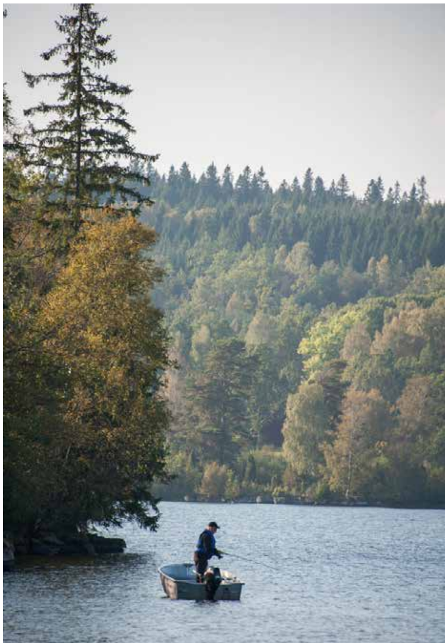
Fiskekortsförsäljningen täcker kostnader för fiskevård och tillsyn och det blir även en del pengar över till ägarna.

– Fiskevårdsområdet har en viktig roll för den växande turismen kring