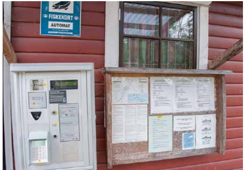
Information är en viktig del av fiskevårdsområdets verksamhet.

Vid ansökningstillfället behövs därför ingen fiskerättsförteckning. Länsstyrelsen gör en första bedömning av förutsättningarna för att ett fiskevårdsområde ska kunna bildas och förordnar en förrättningsman, vanligtvis en lantmätare. Förrättningsmannen får i uppdrag att gå vidare och utreda förutsättningarna för att bilda fiskevårdsområde.